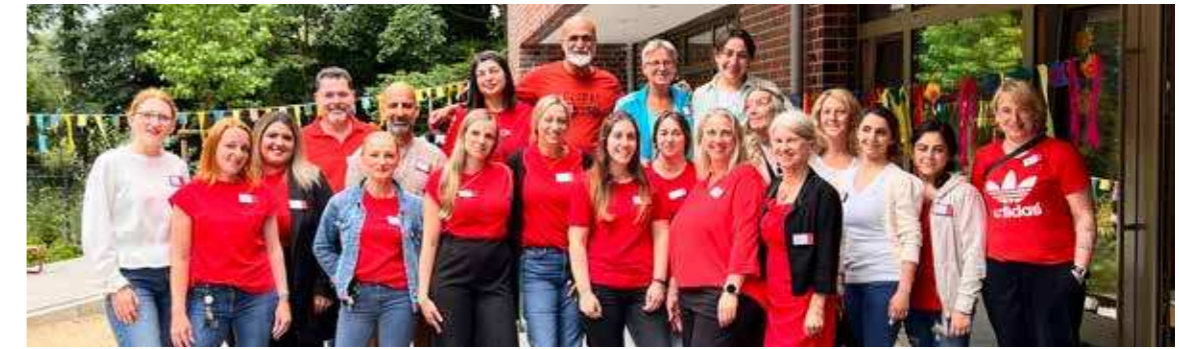
Das Team der AWO-Kita Charlotte Niehaus bei der Einweihung der neuen Kita in Rablinghausen (s. S. 10–11).

Titel: Mitarbeitende und Mitglieder der AWO Bremen beim „Christopher Street Day“ in Bremen, Foto: Anke Wiebersiek / Fotos S. 3: Flonn Große (Editorial) und Anke Wiebersiek.