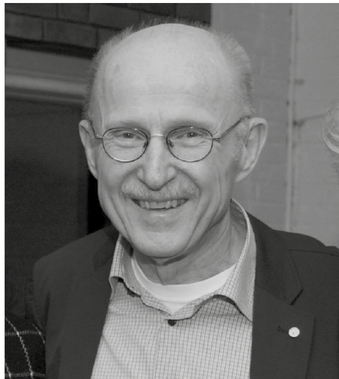
Willi Lemke starb im Alter von 77 Jahren.