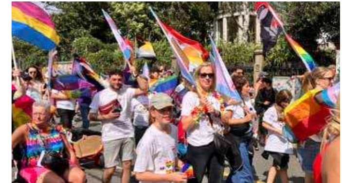
Die AWO Bremen rief Mitarbeitende und Mitglieder auf, am Christopher Street Day teilzunehmen. Mit einem Vortrag zum Thema „Queer im Alter“ gab es zuvor auch ein inhaltliches Rahmenprogramm.