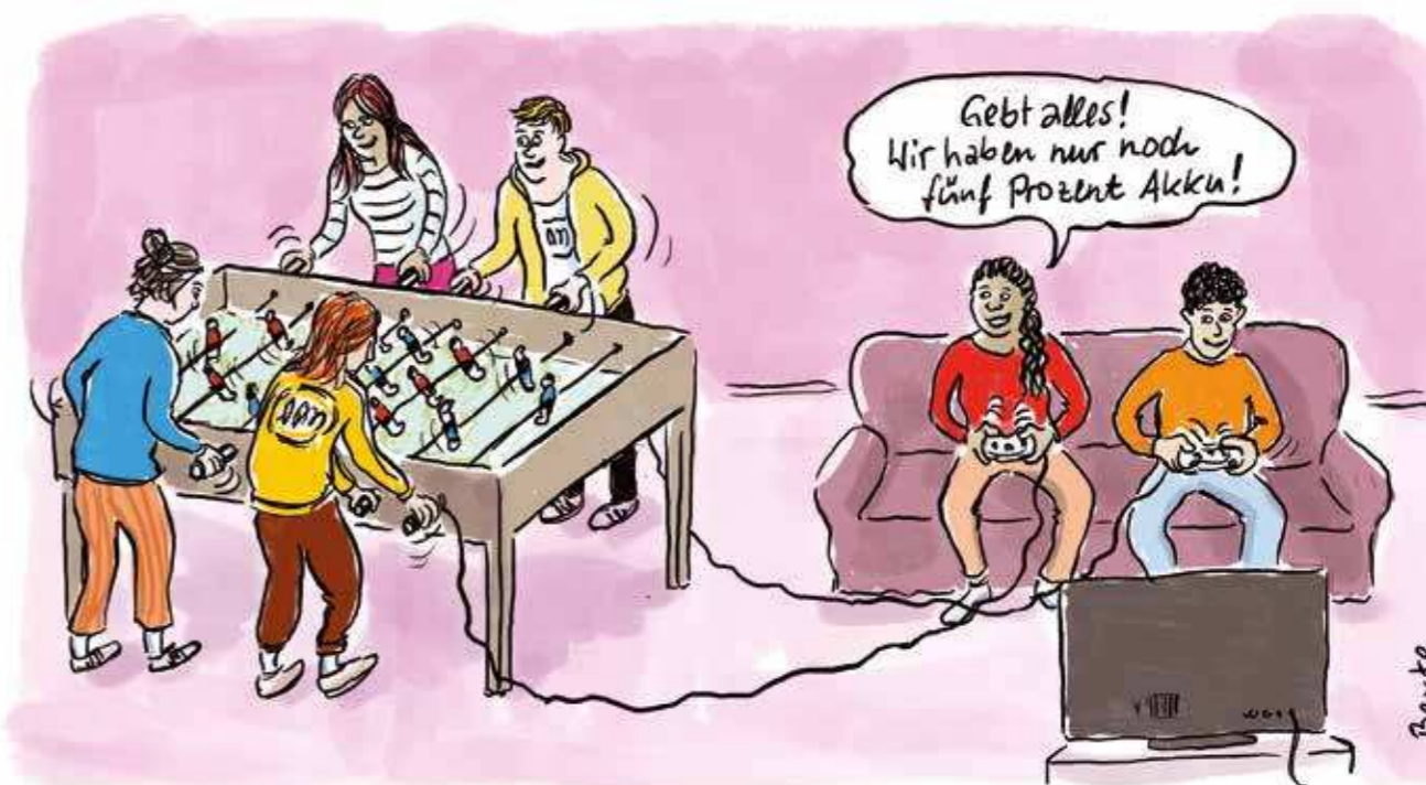
Innovation im Freize: die Kicker-Stromerzeugung

Text: Christine Schmidt | Foto: AWO Bremen