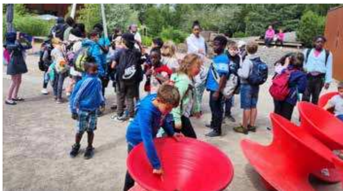
Das Kreisjugendwerk (KJW) hat erneut erlebnisreiche Ferienfreizeiten angeboten: Während des Zeltlagers auf dem Naturcampingplatz am Unisee (re. und oben li.) und während der „Ferien ohne Koffer“ (unten li., Ausflug ins „Universum“).