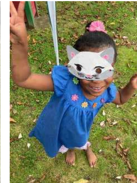
In verschiedenen von der AWO Bremen betreuten Übergangwohnheimen wurden in den vergangenen Wochen bunte Sommerfeste gefeiert ...