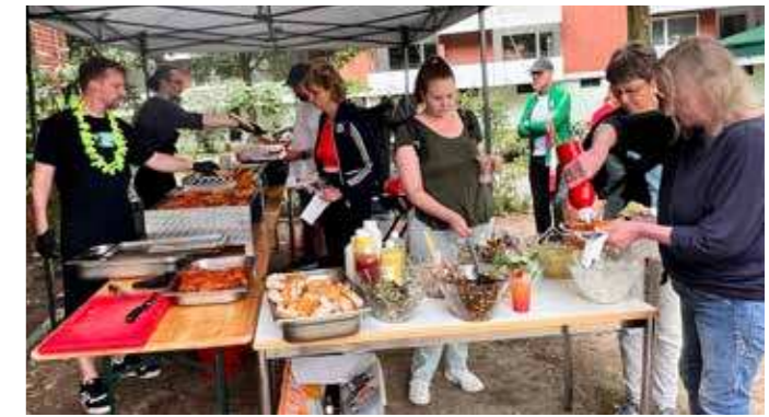
Haus Neuland feierte bei einem bunten Sommerfest mit alkoholfreien Cocktails, leckerem Essen und Live-Musik sein 40-jähriges Bestehen. Die Besucher*innen konnten sich zudem im „Haus Neuland Museum“ Fotos und Exponate der letzten 40 Jahre anschauen (unten li.).