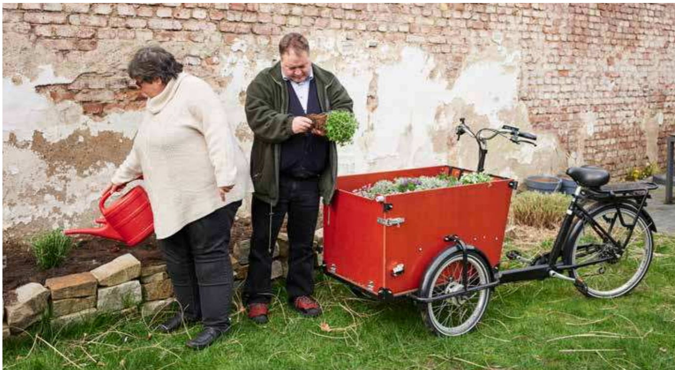
Menschen nach langen Zeiten der Arbeitslosigkeit haben in sogenannten „Arbeitsgelegenheiten“ wieder eine Form der Teilhabe, Tagesstruktur und häufig auch Weiterqualifizierung erfahren, um wieder auf dem Arbeitsmarkt Fuß zu fassen. Wie es damit nun weitergeht, bleibt unklar.