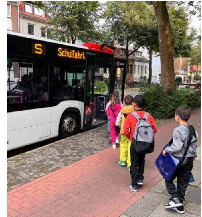
Kinder aus der Landesaufnahmestelle Sankt-Jürgen-Straße warten auf den Schulbus (oben li.) und steigen ein, um zum Unterricht auf dem ehemaligen Kellogs-Gelände gebracht zu werden.